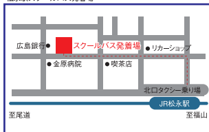
松永駅スクールバス発着場