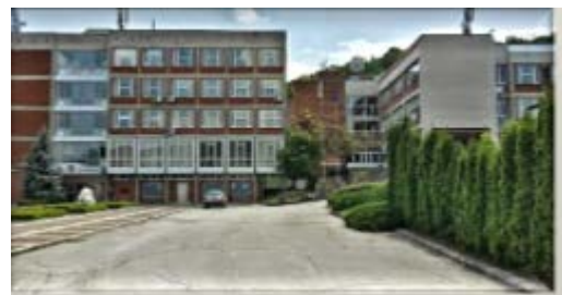
大学の本館：語学の授業や入学式・卒業式が行われる

ヴェリコ・タルノヴォ大学への交換留学を通じ、語学力が向上し、視野がかなり広がったと思います。今までは語学を活かした仕事につきたいと思っていても自分の語学力に自信がなく、国内就職のみを考えていました。しかし、留学をしたことで前より自信を持つことができ、いつかは海外でバリバリ働けるような人間になれるよう頑張りたいと思います。