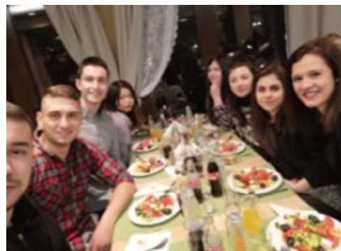
ソフィア大学とヴェリコ・タルノヴォ大学の合同食事会