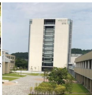
2021年度より新たな薬学研究棟:未来創造館