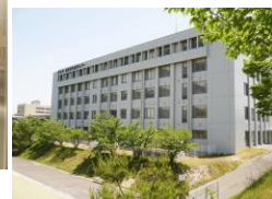
医療薬学教育センター