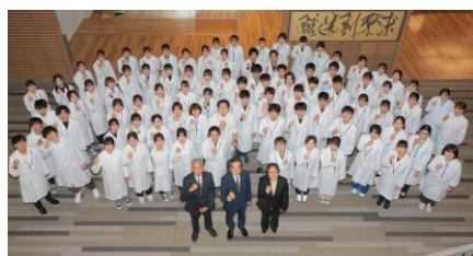
白衣を着て職業人としての決意

日本で最初に『医療薬学教育の実践』を教育理念に1982年に開設され、これまでに約5,000名の卒業生を輩出しています。その98%が薬剤師として活躍し、多くの医療機関から高い評価を頂いています。本学の伝統と実績に裏付けられた教育システムを結集した医療薬学教育センターを中心に、ヒューマンズ教育・医療薬学教育を体系的に行っています。