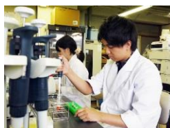
全員が卒業研究に取り組む

基礎から段階的に学べる充実したカリキュラムによって高度な知識と高い実践能力を修得します。全員が、令和3年から新しく建設された未来創造館にある薬学部研究室に配属され、問題解決力を養い、医療人としてのサイエンスを身につけます。