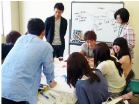
アクティブラーニング