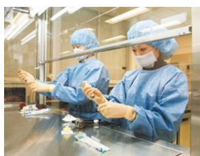
無菌製剤（注射剤）の調製

医療薬学教育のパイオニアとしての伝統と実績に裏付けられた医療薬学教育センターは、全国屈指の医療薬学教育の実践の場です。学生が主体となって学ぶアクティブラーニングはもとより、最新鋭の機器を備え、すべての薬剤師業務を修得することができます。