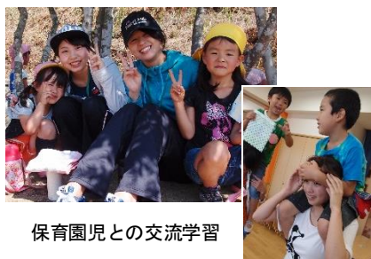
保育園児との交流学习

初年次には病院、保険薬局、ドラッグストアなどを訪問し、薬剤師の役割を学ぶとともに、大学で学ぶ目的を明確にします。本学独自の『交流学习』では、保育園児や高齢者と長期間パートナーとなり、互いの心に寄り添いながら人間関係を築き、ホスピタリティを育み、コミュニケーション能力の向上を図っています。