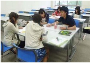
先輩メンターによる学修指導

第109回薬剤師国家試験の国試受験出願者(2023年度6年生在籍者)に対する合格率は70.3%であり、中国四国九州地区においてトップレベルでした。