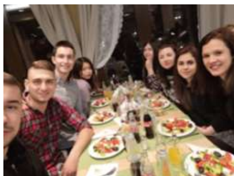
ソフィア大学とヴェリコ・タルノヴォ大学の合同食事会