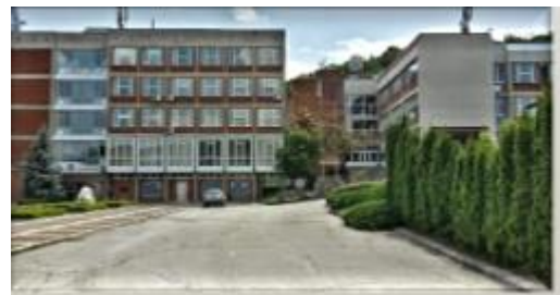
大学の本館：語学の授業や入学式・卒業式が行われる

ヴェリコ・タルノヴォ大学への交換留学を通じ、語学力が向上し、視野がかなり広がったと思います。今までは語学を活かした仕事につきたいと思っていても自分の語学力に自信がなく、国内就職のみを考えていました。しかし、留学をしたことで前より自信を持つことができ、いつかは海外でバリバリ働けるような人間になれるよう頑張りたいと思います。