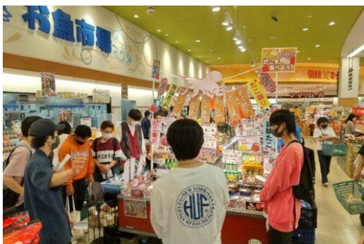
學生深入企業調研，經營者來校講演，理論實踐互動互益

一般企業的財務部門、金融機關（銀行、保險、證券等）、會計事務所、創業、升學研究所等