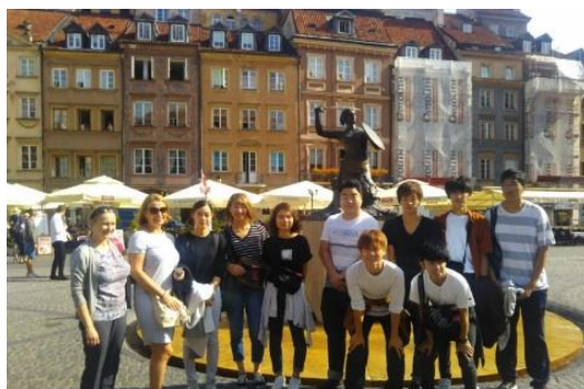
成績名列年級前十名者，海外短期研修費用可獲半額資助