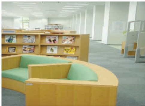
< 新着図書・雑誌コーナー >