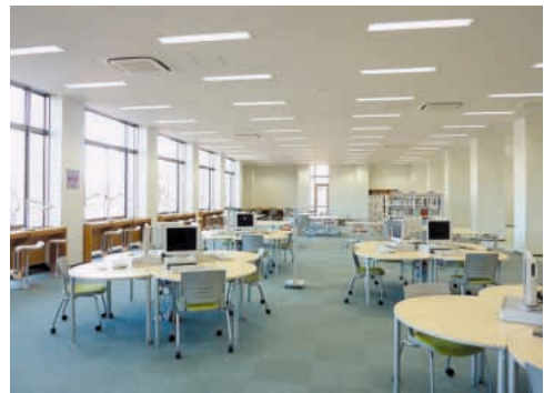
< 情報検索コーナー >

新しくオープンした分館は1号館に近くなり、いろいろな学部学科のみなさんに足を運んでもらい易くなったのではと思います。ご利用お待ちしております。