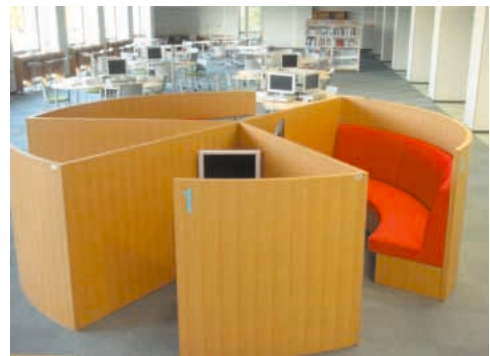
< A Vブース >