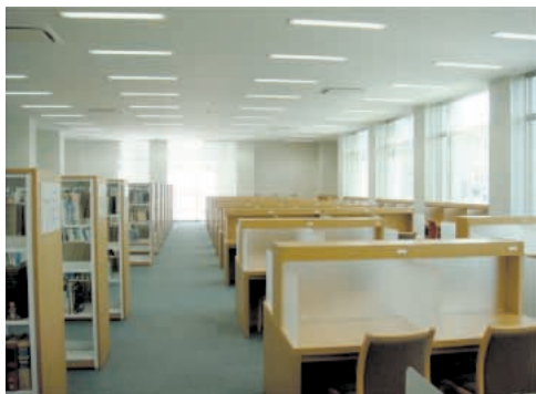
< 仕切つき閲覧机 >

個人学習用の仕切つき閲覧机やA Vブース、グループ学習室、電動書架など、これまでになかったスペースが出来ました。また、今まで置いていなかったファッション誌などの購入も開始しました。