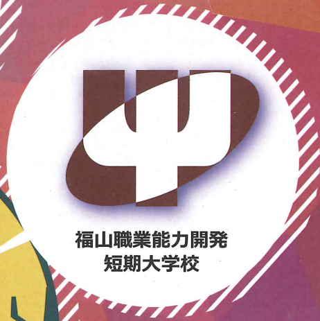
福山職業能力開発 短期大学校