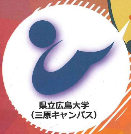
県立広島大学 (三原キャンパス)