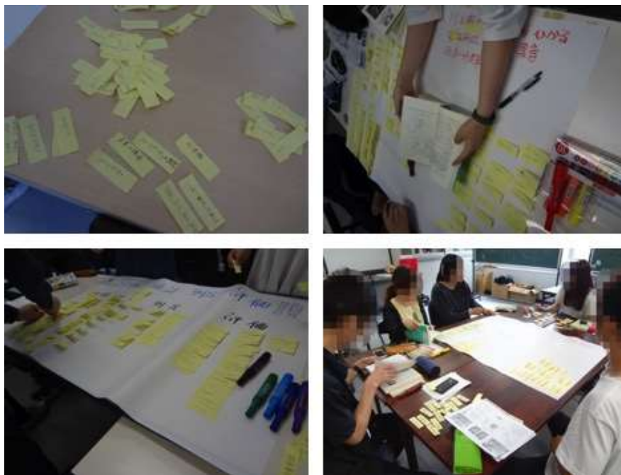
Figure 1. 各班で心理学の専門用語を収集しているときの様子。心理学の様々なテキストの太字・アンダーライン箇所を中心にキーワードを付箋紙に書き出している。その後で問題領域の下位区分毎に整理。例えば、「学習・認知・知覚」の担当班であれば「学習」に関わるキーワード、「認知」に関わるキーワード、「知覚」に関わるキーワードごとにまとめる。

本課題でまず受講者は重要な心理学の専門用語（や著名な心理学者名）の収集をおこなった。受講者はひとり一冊、心理学の書籍や辞書を持ち寄り、見出しのキーワード、太字・アンダーラインされたキーワードを付箋紙に書き出していった（Figure 1 左上）。その後、問題領域の下位区分ごとに付箋紙を集約していった（Figure 1 右上、左下、右