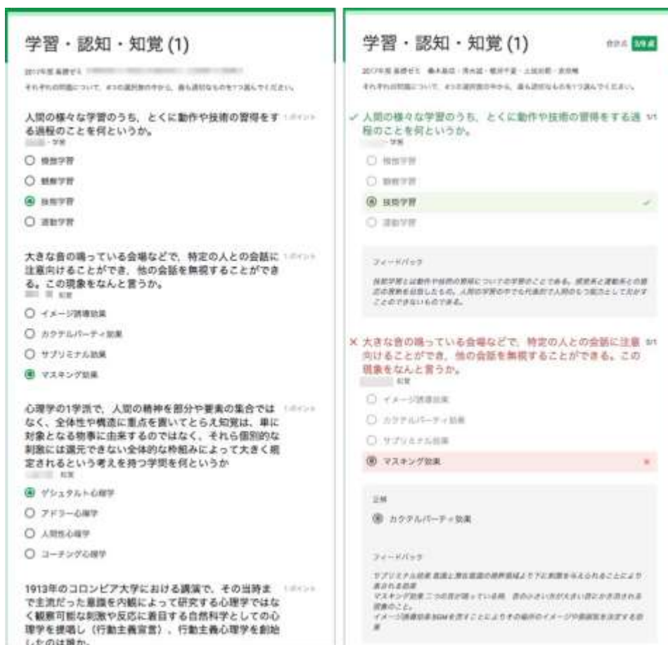
Figure 3. Google フォームを用いたオンライン学習教材の例 (左が問題, 右側が正誤フィードバックおよび解説画面)

は、一般に「逆境指数」と訳される。AQ は日常のさまざまな逆境に対する個人および組織の対応力を測定、数値化するものであり、その考え方や手法はアメリカの組織コミュニケーションの研究者であるポール・G・ストルツ (Paul G. Stoltz) 博士によって考案された。」「選択肢 4 に対する解説文: FQ (Financial Quotient), 時にも FI (financial intelligence) ・ FiQ (financial intelligence quotient) ・ financial IQ と呼ばれる資質である。」であった。作成した 9 つの情報は、後ほど再利用しやすいように各班でスプレッドシート上にまとめたあと、Google フォームに反映し、オンライン学習教材とした (Figure 3)。