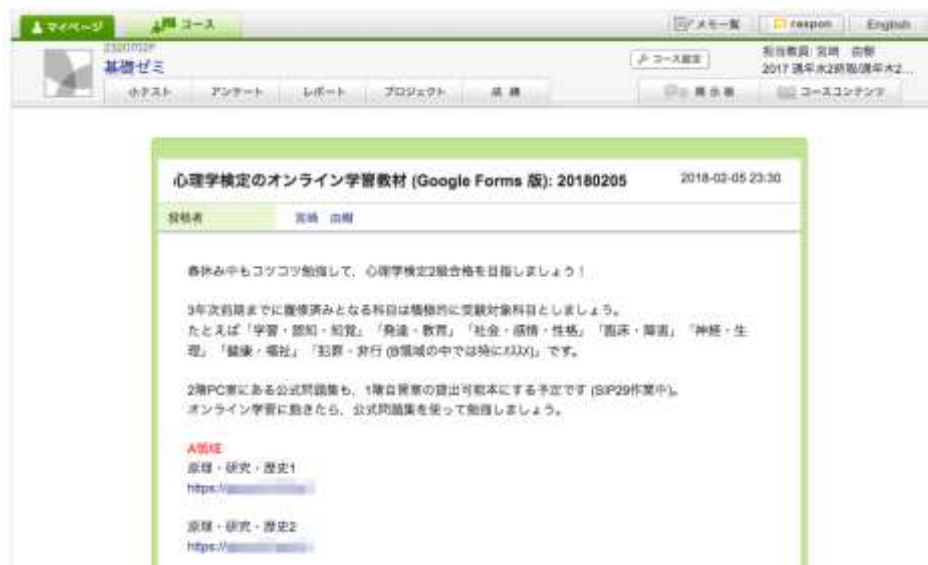
Figure 4. Cerezo のコースニュースや掲示版にて、受講者が作成したオンライン学習教材を共有。