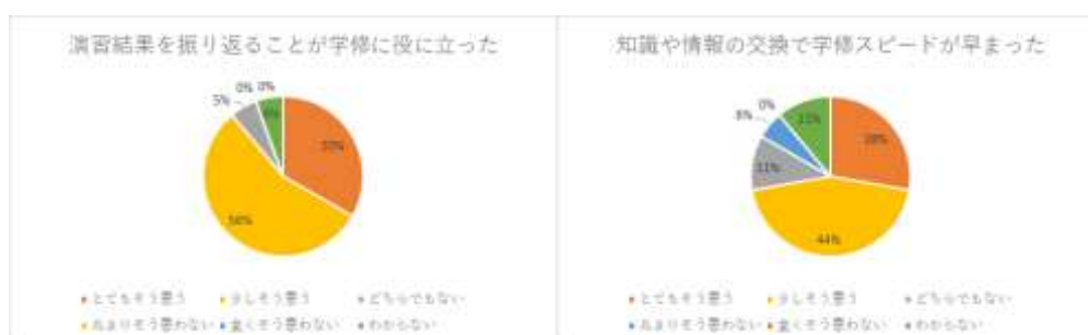
図4 アンケート結果 (一部)