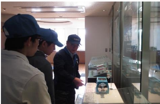
学生深入企业调研，经营者来校讲演，理论实践互动互益