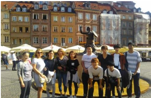
成绩名列年级前十者，海外短期研修费用可获半额资助