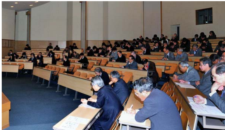
F D 講演会