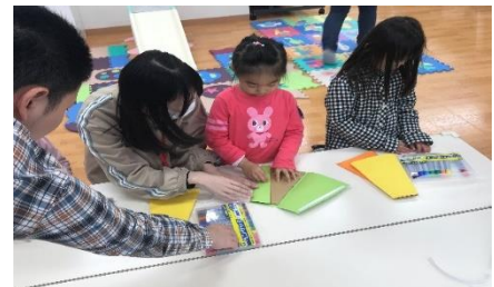
学生スタッフもお手伝い!